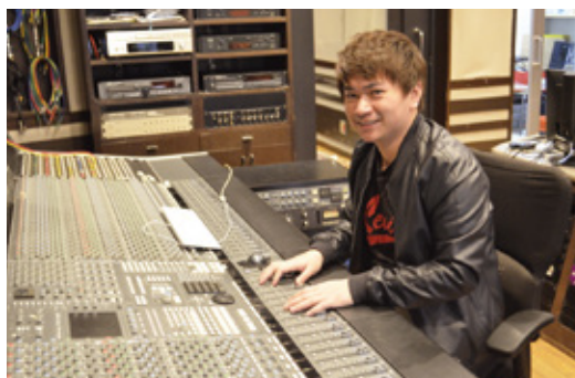
在校内的录音棚中

与讲师一起体验专业现场的经验是一个很重要的筹码。能够得到这家工作室的内定,契机也是因为曾被老师带来过这里参观。虽然参加过许多其他录音室的工作,但是这个工作室的氛围十分吸引自己,强烈地觉得想在这里工作。当公司开始招收新毕业生的时候我得到了邀请,并且顺利地获得了工作机会。在学校,我们与作曲专业的学生共同制作乐曲。录音师的工作是理所当然的,我还学会了团队协作一起完成工作。不要只与同一个国家的人交谈,与日本人以及来自不同国家的留学生多进行交流,让自己的日语说得更加流利才是最重要的。