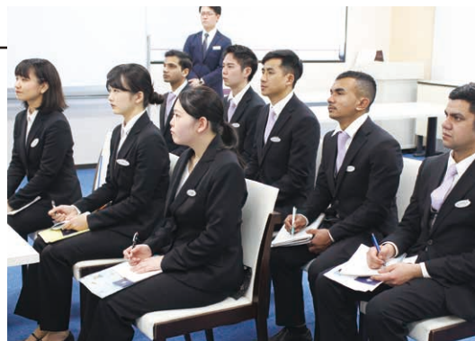
认真听讲的留学生们