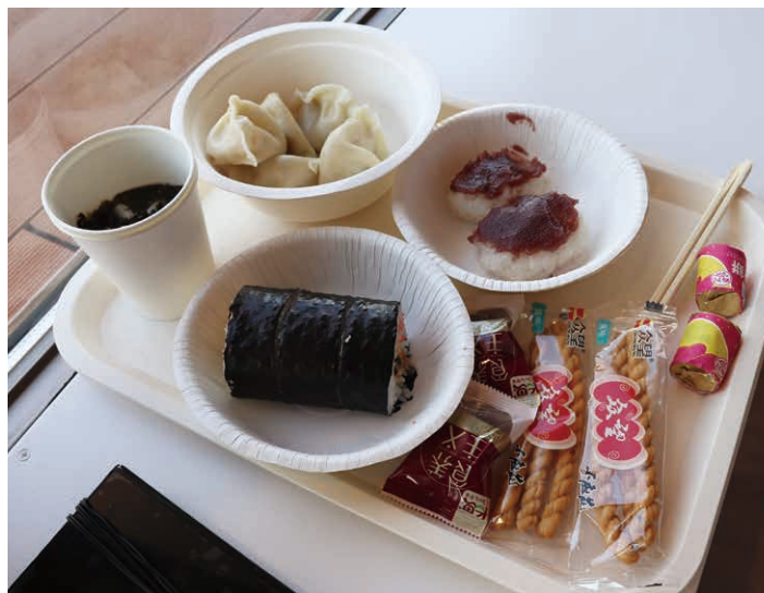
学生们亲手做的料理