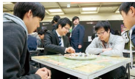
加入游戏并解说游戏规则