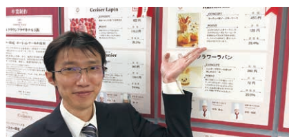
在此发挥2年的成果!