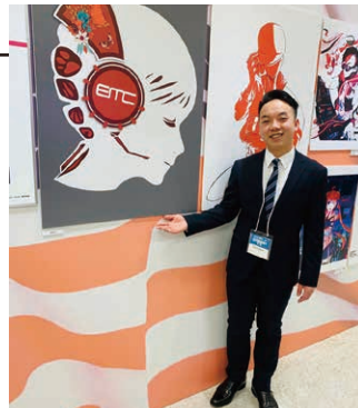
在EMC壁画设计作品前合照(We are TECH.C 2019)