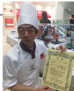
获得巧克力项目学生组最优秀奖!