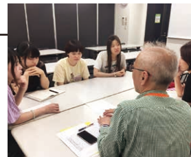
和团队集思广益出好点子