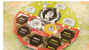
大家一起制作的桌游