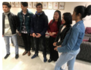
通过新生说明会加深交流的留学生们

4月3日(周三)是福冈校的联合入学典礼,福冈IR&婚庆·酒店专门学校共有来自尼泊尔、斯里兰卡、越南的15名留学生入学。此外,学校也转为新生们举办了新生说明会,颁发教科书和课表。特别对留学生的新生、在校生们的签证、打工、生活支援等各方面进行详细的说明。新生们可能都有许多感到不安的地方,学校都会尽全力协助你们的,请放心吧!