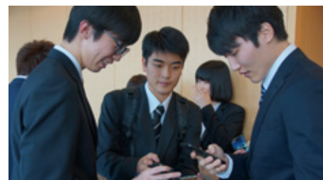
正在交换联络方式