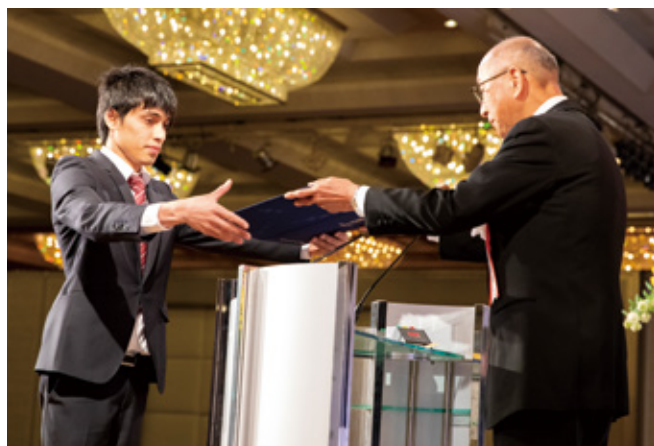
留学生代表领毕业证书