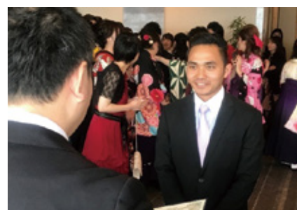
和老师依依不舍的尼泊尔留学生

2019年3月4日(周一)福岡IR&婚庆·酒店专门学校在福岡海鷹希尔顿酒店举办了毕业典礼,留学生们也一同毕业了。作为最后一堂课的毕业典礼,除了有颁奖及校长致辞等环节,还有姐妹校的合唱团表演,令人十分感动。典礼结束后老师们给学生们一名一名颁发毕业证书,留学生们都自豪地接下毕业证书,并在学校结交到的许多日本人朋友们依依不舍地道别。毕业后有人准备进入日本的酒店就业、有人回国就读大学或就业,每个人都有各自前进的方向。祝各位鹏程万里,发挥所学,精彩活跃吧!